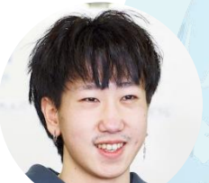
トさん(中国出身) 杜同學(來自中國)

ECCの授業はよくある古い学校の教え方ではありません。新しい文法を教えながら、実用的な日常会話を大事にしています。日本人の先生たちと話すことで実践的な力が身につきます。二週に一回のプレゼンテーションでは、話す力と同時に日本語の文を書く力、そして大人数の観客の前で発表できる力を訓練できます。私がこの8か月で一番上達したと感じるのは、自分が言いたいことを日本語でちゃんと伝えられるようになったことです。