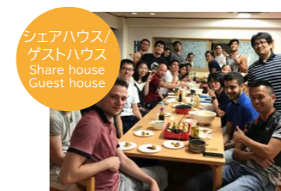
シェアハウス/ ゲストハウス Share house Guest house