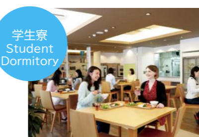
学生寮 Student Dormitory

ECC日本語学院では皆さんが安心して日本での生活が送れるよう提携しているマンションやゲストハウス、学生寮などをご紹介します。滞在先の手配をご希望される方は、滞在先施設のタイプやご予算など、ECC日本語学院までお知らせください。To help students enjoy a stress-free life in Japan, the ECC Japanese Language Institute can introduce them to a large number affiliated apartments, guesthouses, student dormitories, and homestay options. If you need assistance finding accommodations, please inform us of your desired type of accommodation and your budget.