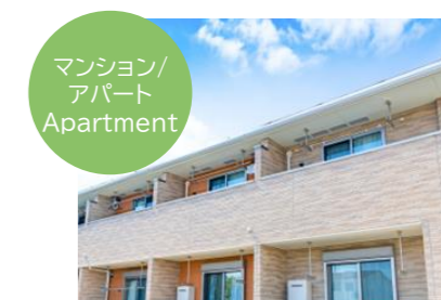
マンション/ アパート Apartment

朝夕2食の食事付きで、お部屋には生活に必要な家具・備品が既に備え付けされている為、最も経済的な滞在方法です。 This is the most economical option, as breakfast and dinner are provided at no extra cost, and the rooms are furnished with all the necessities required to enjoy your time in Japan.